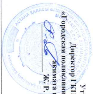
График работы сотрудников отделения женской консультации на апрель 2026г.