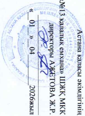
График диагностического отделения на Апрель месяц 2026 года