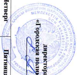
График работы ВОП 2 на апрель с 01.04.26г по 21.04.26г