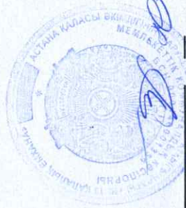
График работы за апрель месяц 01.04.25г-30.04.26 ВОП-3