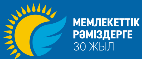
ЛОГОТИП НА ОДНОРОДНОМ ФОНЕ